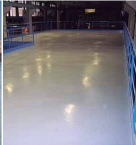
UPC - BCN