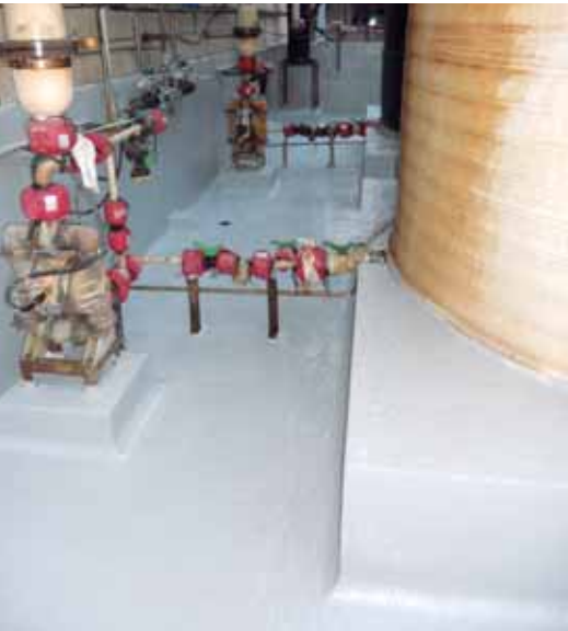
St. Celoni - Ind. Química