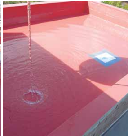
c. Marqués de Monistrol - St. Feliu de Llobregat