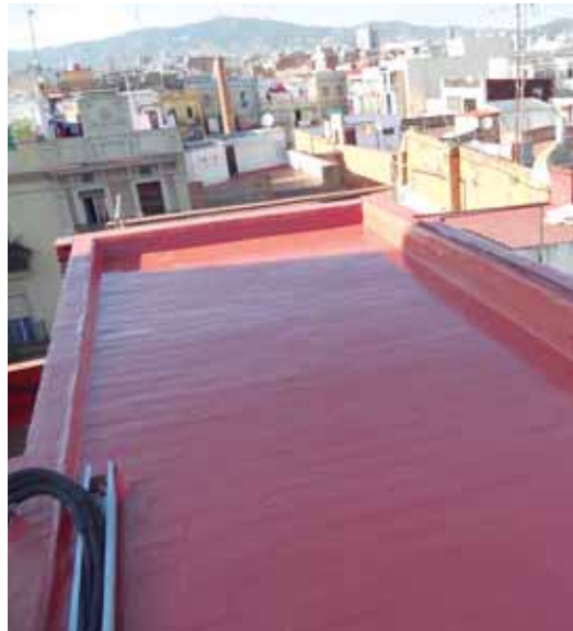
c. Parlament - BCN