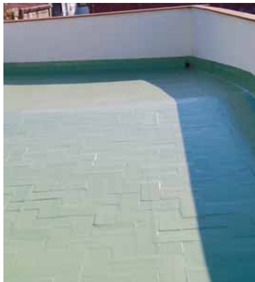
c. Hospital - BCN