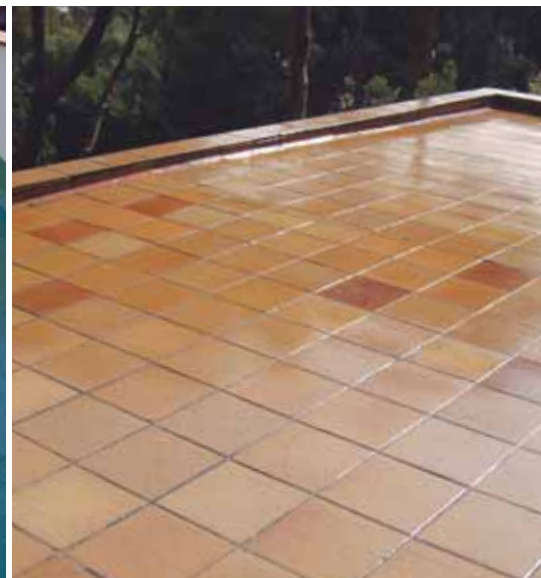
Montornès del Vallès