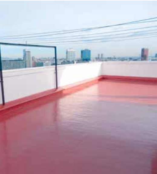
Plaça de Sants - BCN