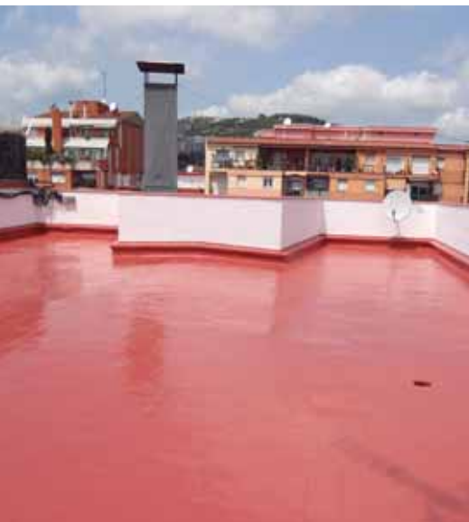
c. Indústria - BCN